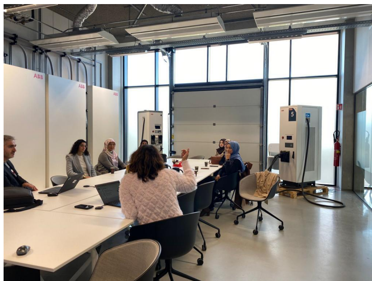
Bedrijfsbezoek ABB E-mobility: rondleiding + kennis over duurzaam rijden