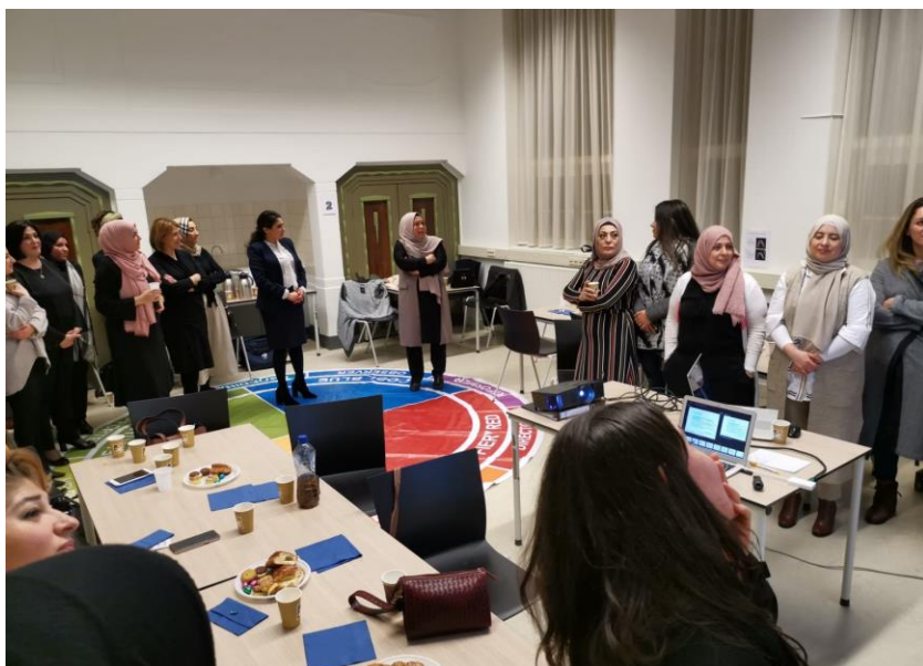
Training: Persoonlijke effectiviteit en samenwerking

Inspire Women's Network fungeert als een dynamisch platform waar professionals elkaar niet alleen inspireren, maar waar ook het opbouwen van een krachtig netwerk leidt tot zowel individuele als collectieve groei. We geloven in de voortdurende professionalisering van onze deelnemers, gericht op het optimaliseren van kansen op de arbeidsmarkt en het stimuleren van ondernemerschap. Als verbindende schakel tussen verschillende werelden willen we onze ervaringen, kennis en netwerk inzetten om het algemeen belang te dienen. We zijn vastbesloten om deuren te openen, kansen te creëren en een positieve impact te hebben op individuen en de bredere samenleving.