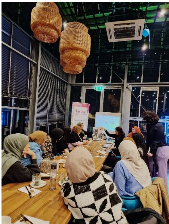
Samenwerking met Stichting Unito voor het bundelen van krachten m.b.t. goede doelen acties