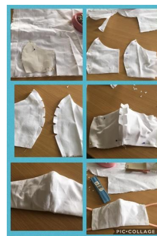
Foto: tijdens de pandemie hebben we onze krachten gebundeld om het tekort aan mondkapjes te overmeesteren. Middels laken donaties (Van der Valk) hebben wij een duurzame oplossing gevonden