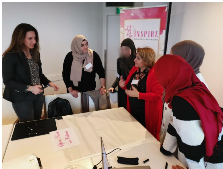
Leiderschapsacademie waarbij we in groepen werken aan het opzetten van een samenwerkingsproject per thema