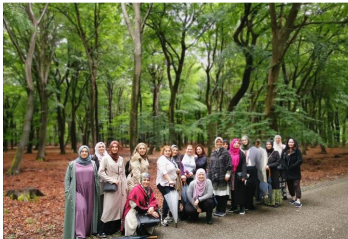
IWN natuur en wellness weekend: ontspanning en netwerken

Onze activiteiten zullen worden gefinancierd via een combinatie van donaties, sponsorbijdragen en eventuele subsidies. Daarnaast zullen we ook elders fondsen werven om onze financiële basis te versterken en de continuïteit van onze initiatieven te waarborgen.