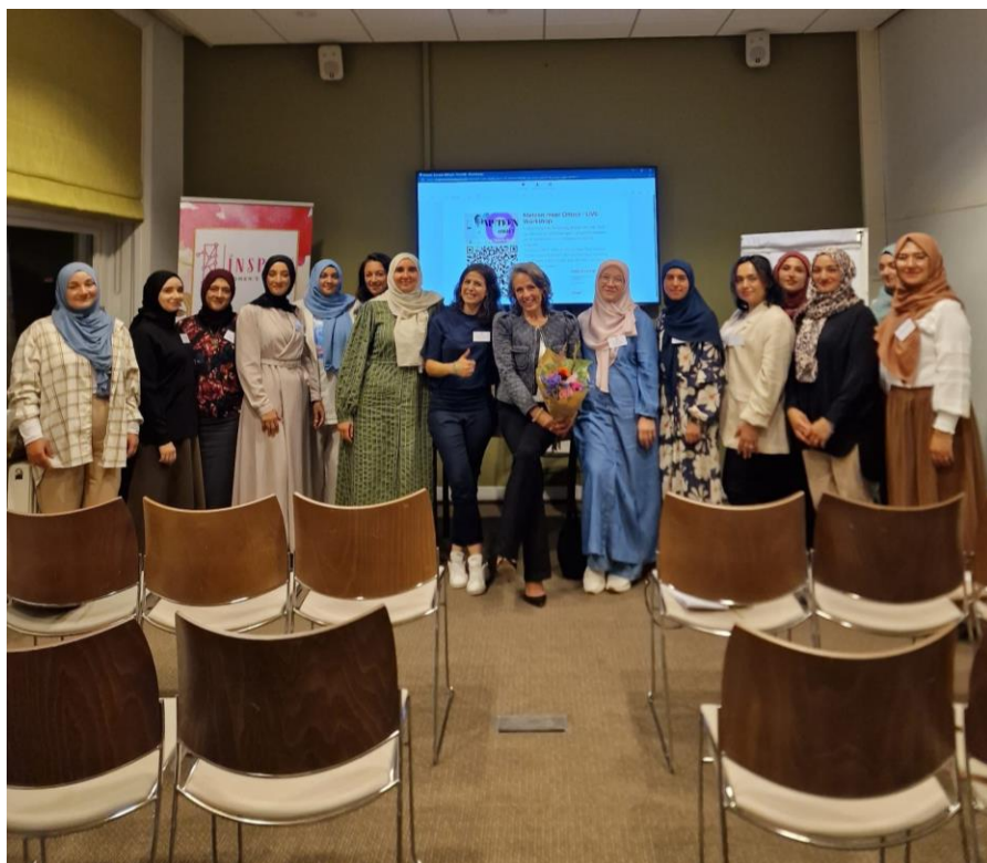
Netwerkbijeenkomst 'Groeien met je onderneming': training en lezing over online marketing + succesvol ondernemen

Stichting Inspire Women's Network zet zich in om deze culturele waarden te